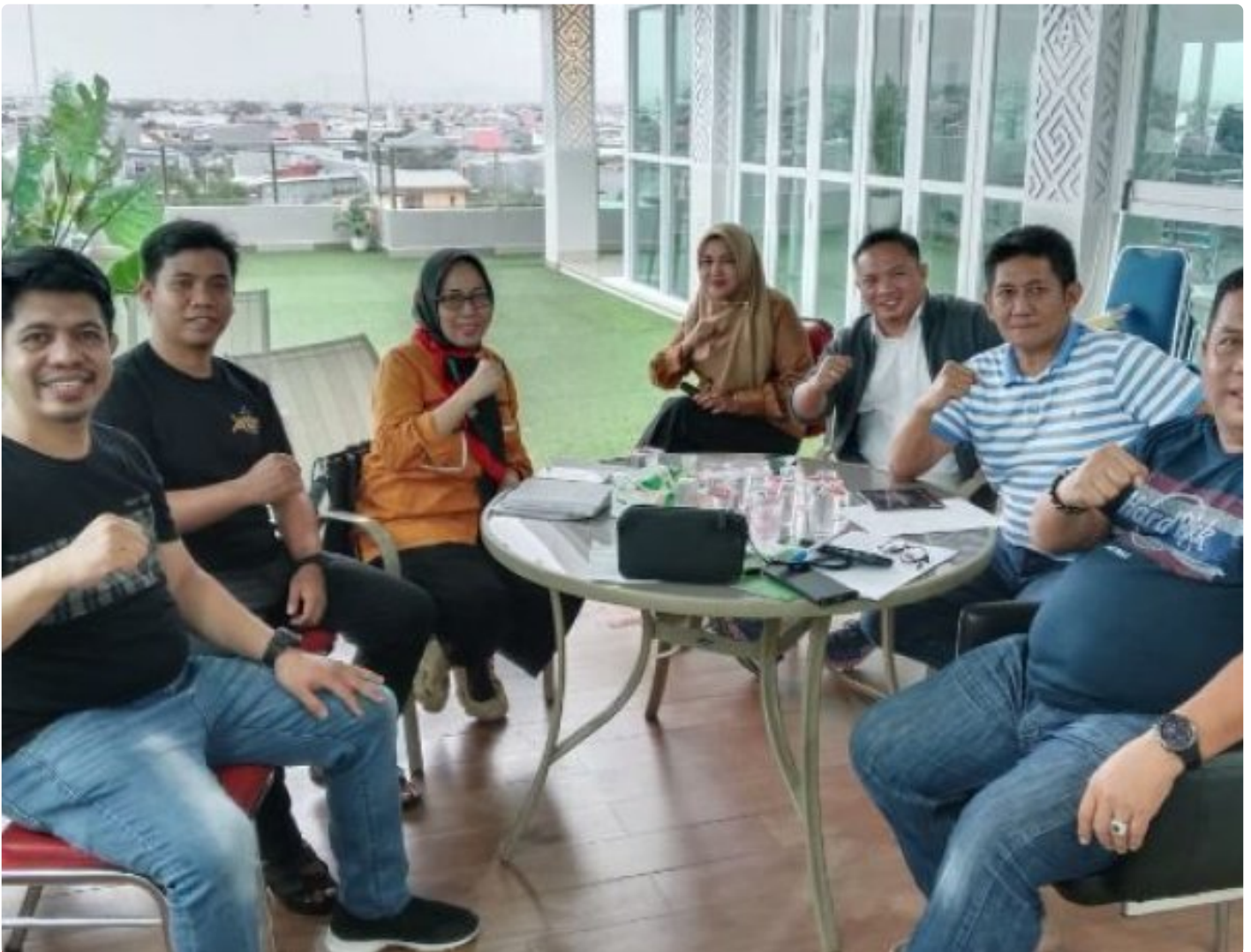
FORKODA PP-DOB Sulsel Jadwalkan Pelantikan dan Raker 18 Januari di Hotel Claro Makassar

MAKASSAR — Forum Komunikasi Daerah (FORKODA) Percepatan Pembentukan Daerah Otonom Baru (PP-DOB) Provinsi Sulawesi Selatan dijadwalkan menggelar pelantikan dan rapat kerja (raker) pengurus pada Minggu, 18 Januari 2026 mendatang.